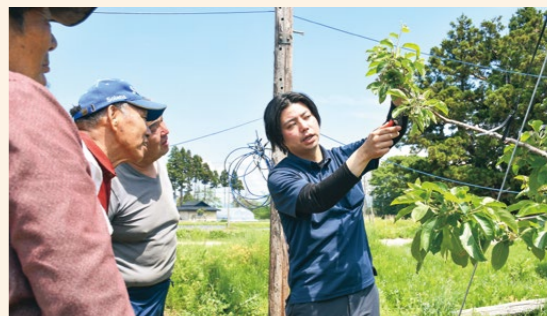
JA職員による摘果を見学する生産者たち(5月13日、花巻市糠塚にて)

JA職員は、生育の前進による早めの作業実施を呼び掛けたほか、摘果は満開30日後までを目安に、各農家の主力品種から取り組むことを推奨しました。また、昨年多発したカメムシ類への対応として「園地を視察し、飛来を確認次第、速やかに対処すること」と話しました。