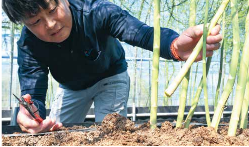
新鮮なアスパラガスは収穫時に切り口から水があふれる