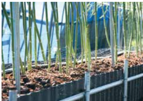
自作した給水設備でかん水を行う