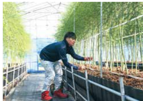
高畝栽培で生育管理を行う