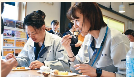
スイーツを試食する参加者たち

同日はJAや市職員、来店客が試食会に参加し、風味や食感に対する感想をアンケート用紙に書き込みました。