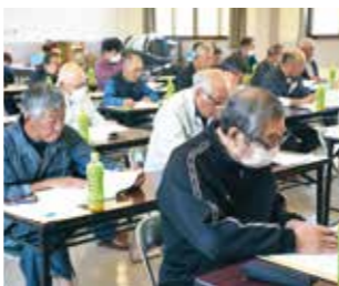
遠野園芸センター(遠野市青笹町)で行われた総代研修会

Q 第28回通常総代会と総代研修会(5月15日、20日・14会場・338人)での主な質問と、それに対する回答をお知らせします。