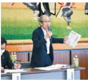
和賀町・岩崎・横川目支店(北上市和賀町)で行われた総代研修会

Q 米価の動向はどのような見通しか。 A 令和7年産米は、店頭販売の動きが鈍く在庫が増加しているものの、当JAの販売契約はほぼ完了しております。なお、本精算は9月を予定しています。令和8年産米価格は需