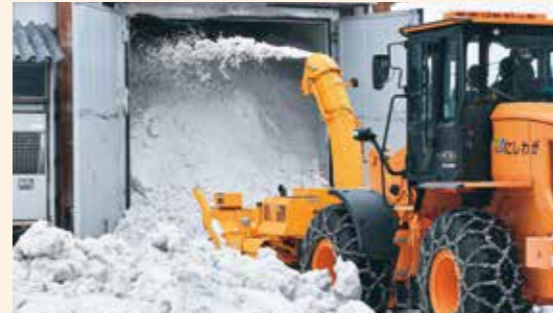
雪を吹き付けながら雪室に詰めていく除雪機

同日は、町の作業員5人が除雪車を使用して雪を室内に隙間なく吹き付けながら詰めていきました。雪冷式の貯蔵庫は、冷蔵庫に比べ温度変化が少なく高湿度となるため、野菜や花の鮮度・品質を長期間維持できます。3月中旬から9月中旬まで農産物の貯蔵に使用されます。