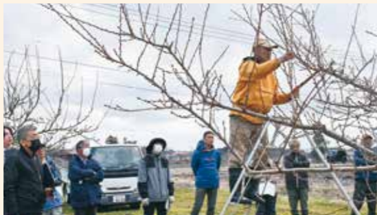
剪定を実演する県中部農業改良普及センターの職員

講師を務めた同センターの職員は、若木と成木それぞれの剪定を実演し、樹勢や作業効率を考えて整枝を行うよう説明しました。