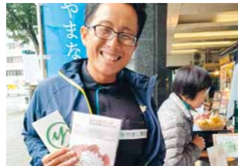
販促イベントで家庭向けのわらび粉をPR