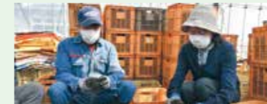
種いものを丁寧に選別していきます