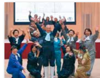
動画はYouTube「100ダン 花巻」で検索！

メンバーは、100周年記念ソング「Rice Vegetable Meat」のサビに合わせて、約30秒のダンス動画を撮影。もんぺと作業着を着用したほか、当JAの「家の光文化賞」受賞を振り返るスライドショーを流し、創刊からの歴史を表現しました。