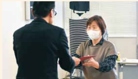
表彰状を受け取る生産者

審査を担当した県中部農業改良普及センターの職員は「夏場の高温で出荷数量が減少する中、出荷数と販売額を維持し、産直の発展に大きく貢献いただいた」と受賞者を称えました。