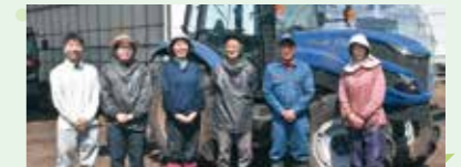
和気あいあいと楽しく作業しています