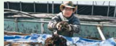
種いもの掘り出し作業の様子

自然と触れ合う仕事に魅力を感じて応募しました。「アグリワーク」では希望条件を丁寧に聞いてくれるので、安心して職探しできました。太陽の光を浴びて気持ちよく働いています。