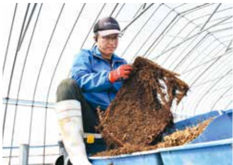
3月下旬からスタートしたわらびの苗作り