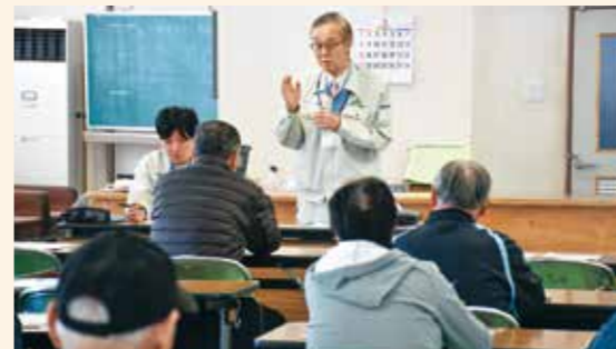
花巻市太田で開いた指導会の様子(3月13日)

4月からは気温上昇が予想されることから、細菌病対策として温度と水管理を徹底することや、夏季の高温によって登熟が早まっていることを踏まえて移植日を決定するよう伝えました。