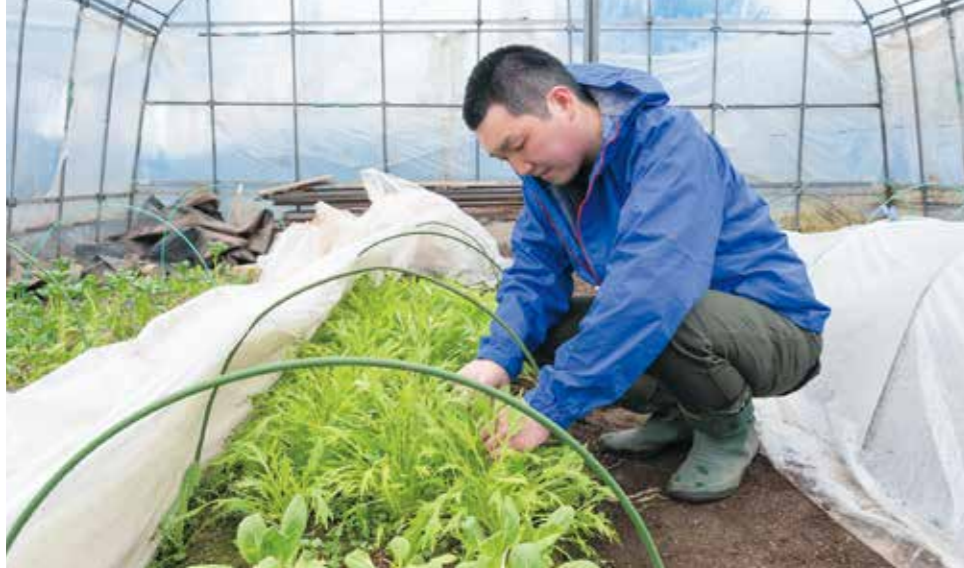
ペピーリーフの収穫作業。6月まで毎日収穫が続き、母も手伝う