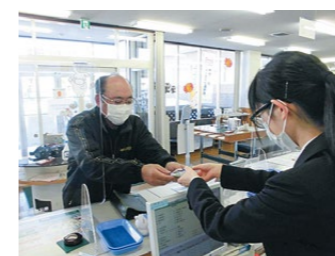
お客様にプチギフトを手渡す職員(右)