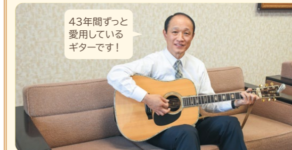
43年間ずっと愛用しているギターです!