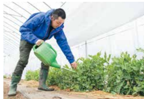
絹さやエンドウの水やり作業。1本1本丁寧に育てる