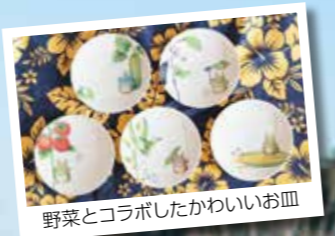
野菜とコラボしたかわいいお皿

趣味・マイブーム 旅行 沖縄県と「三鷹の森ジブリ美術館」が好きで、コロナ禍前はそれぞれ年3回ほど行っていました。自然が大好きで、沖縄県はきれいな海と暖かい気候が魅力です。