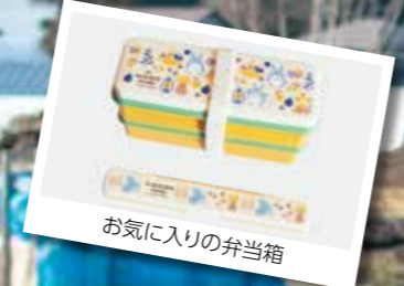
お気に入りの弁当箱

皿やタンブラー、水筒などのジブリグッズを集めています。弁当箱は、妻の手作り料理を入れて毎日職場に持って行っています。