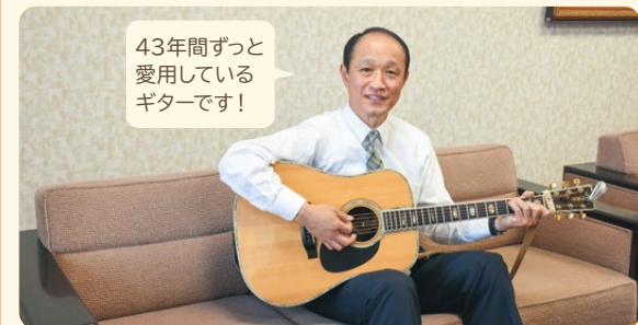
43年間ずっと愛用しているギターです!