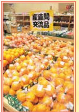
産地間交流をしている全国のJAファーマーズマーケットの品物がズラリ。管内では生産出来ない果物や作物が年間を通して並びます