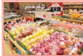
地元産果実のほか、リンゴジュースやジャム、はちみつなどの加工品が並び、内陸で生産されたリンゴなども販売