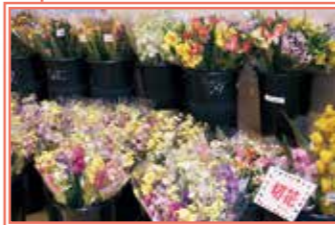
入り口では季節の切花や鉢花など、色とりどりのお花がお出迎え