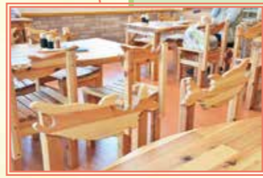
農林中金と釜石地方森林組合から寄贈頂いたサケや海をモチーフとしたイスやテーブル

「日替わり母ちゃんおまかせ丼」その日水揚げされた海産物を使用した丼物。何が食べられるかは出てきてからのお楽しみ(550円)