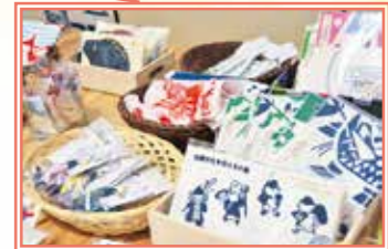
大槌町の特産品などをモチーフに作られたコースターやストラップなどのハンドメイド作品や手ぬぐいなどのグッズも盛りだくさん