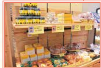
地元菓子店の商品や贈答品が並び、地元産物のほか、これまでになかった海の幸が楽しめるのはだあすこ沿岸店ならでは。JAは地元の水産業関係者や地域と手を取り合いながら、だあすこ沿岸店を拠点とした地域農業や産業、くらしの活性化を目指し、地元根ざした運営を行っています。