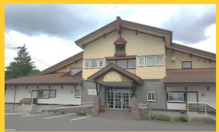
ホテルベルンドルフ 浴場「ぶどうの湯」(大迫)