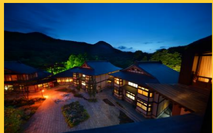
山の神温泉 優香苑(花巻)