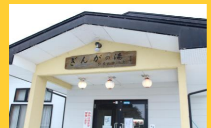
ひまわり温泉 「ぎんがの湯」(石鳥谷)