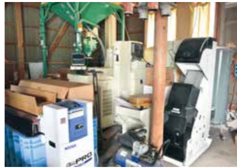
色彩選別やフレコン準備もできるように機械を完備