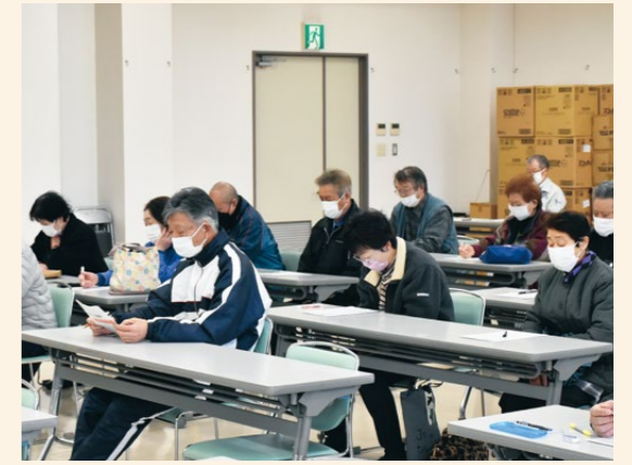
指導会の内容に耳を傾ける参加者たち

J Aは3月7日から15日にかけて、花巻市内の12会場で水稲栽培指導会を開きました。 12日に石鳥谷東支店(同市石鳥谷町)で開いた指導会には生産者約30人が参加。J A職員は昨年の気象状況を説明し、融雪後の排水管理や浅水代かきの実施など、ガスわき対策の徹底を呼び掛けました。また、収穫時期について「昨年は高温の影響で例年よりも刈り始めが早かった。適期の収穫を心掛けて、胴割粒や白未熟粒などに気をつけてほしい」と話しました。 参加者は、令和5年度の生育状況や令和6年度の栽培重点事項を確認し、栽培管理について理解を深めました。