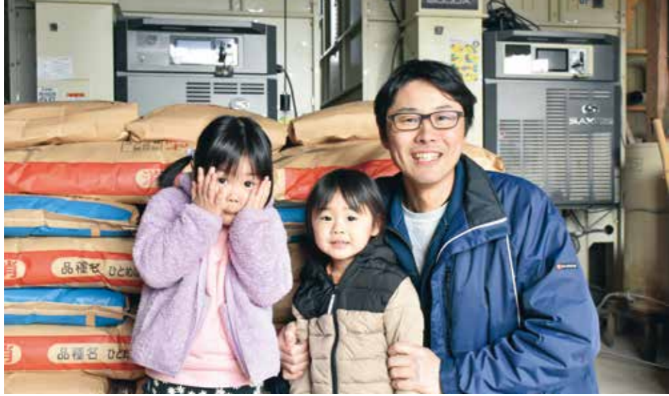
「子どもたちも農業が好きになってほしい」と話す康史さん