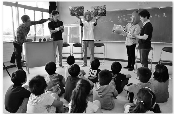
小学校で出前授業を行う果樹部会の THE RINGO STAR のメンバー

また、各生産部会でも、農家が保育園児と収穫体験を行ったり農作物の無償提供や小学校で出前授業をするなど、後継者育成や地域農業の尊さを子どもたちに伝えています。