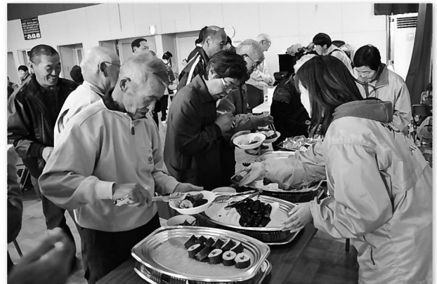
各支店が行う企画には大勢の人が集まり交流を深める

食と農を基軸とし、支店ごとに工夫を凝らした企画で地域とJ Aの繋がりや結びつきの強化を図っています。