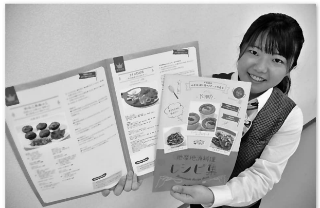
地産地消の更なる広がりを目指し作成した「レシピ集」

レシピはJ Aが主催する「地産地消料理コンクール」の応募作品を掲載し、教育機関や食育の現場、家庭や集落に配布し、地産地消の定着と更なる広がりを推進しています。